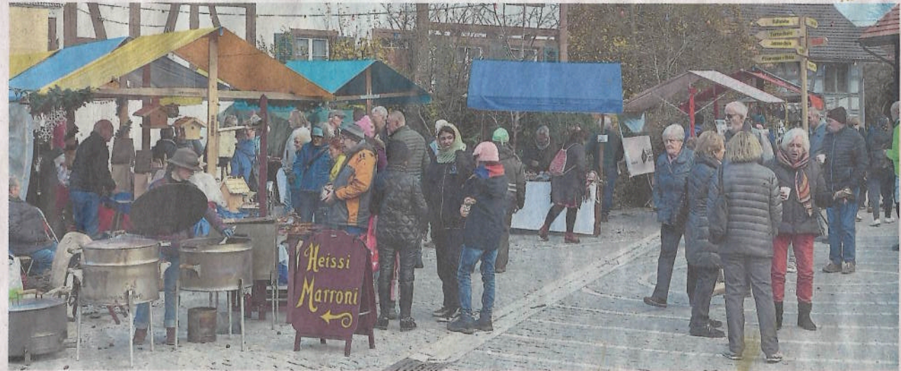
Der Thalheimer Dorfmarkt hat dank der ausgesuchten Marktfahrer ein besonderes Flair.

Das Organisationskomitee ist ebenfalls mit dem guten Verlauf zufrieden und kündigt den Termin für nächstes Jahr an: «Uf Wiederluege am 18. November 2023.»